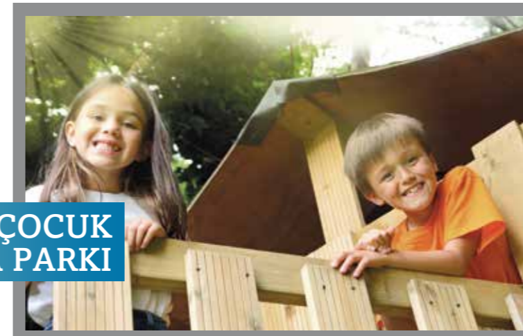
ÇOCUK MACERA PARKI