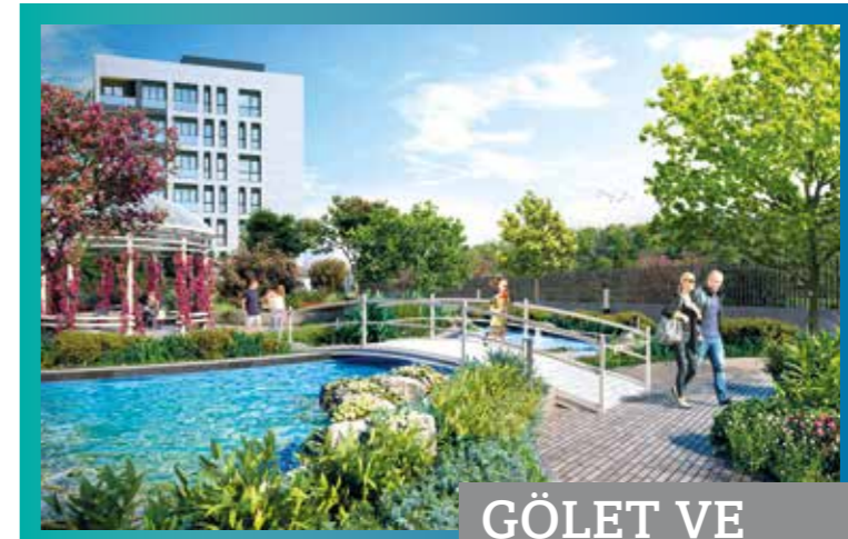
GÖLET VE KABANALAR