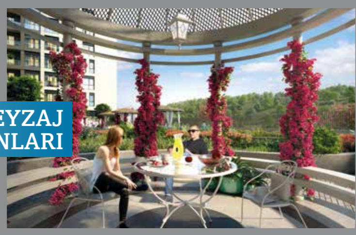
GENİŞ PEYZAJ ALANLARI