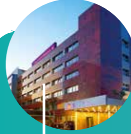
Florence Nightingale Hastanesi