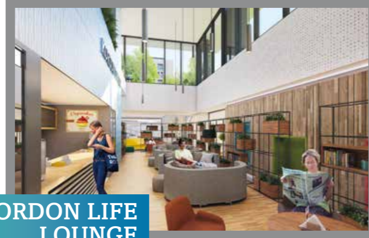
KORDON LIFE LOUNGE ALANI