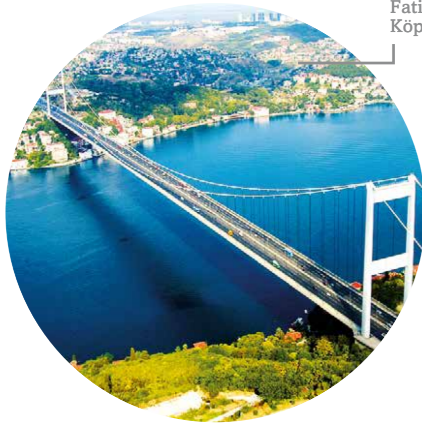
Fatih Sultan Mehmet Köprüsü

Axis AVM Özdilek AVM İstanbul Sapphire AVM Cevahir AVM Kanyon AVM Metrocity AVM İstinye Park AVM