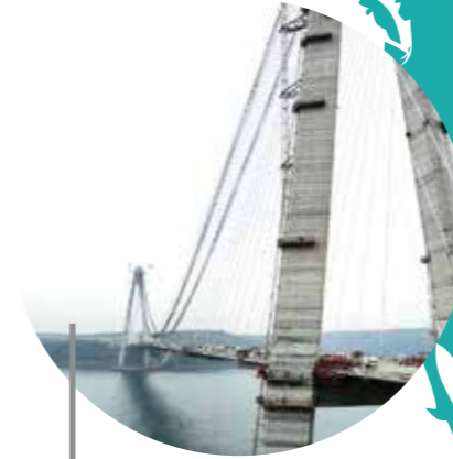
Yavuz Sultan Selim Köprüsü